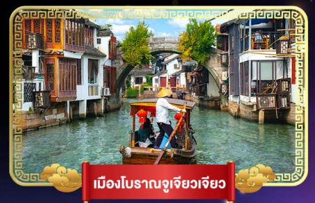
เมืองโบราณจู่เจียเจี๋ย