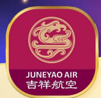
JUNEYAO AIR 吉祥航空

เที่ยวสุดคุ้มไม่ลงร้านรัฐบาล ส่งเรือชมเมืองโบราณ เดินชิลริมน้ำย่านเดอะบันด์